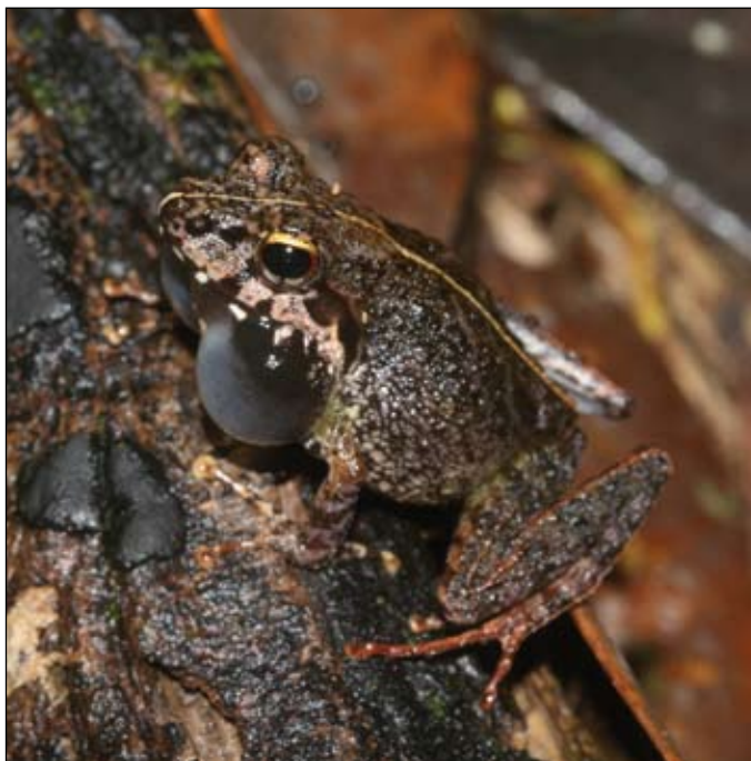
Gephyromantis boulengeri , Betampona

A dedicated website has already been created at www.sahonagasy.org and this will be developed further for the purposes of the IUCN/ASG in Madagascar. Beside this, it is also worth stating that some parallel initiatives have been suggested. As an example, Association Vahatra is