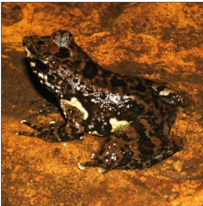
Mantidactylus sp. aff. femoralis , Betampona

ques: il est possible d'accomplir avec succès des inventaires de têtards à la fois pendant les périodes sèches dans la saison pluviale et pendant les saisons sèches. Durant ces périodes, l'activité de chant et de reproduction en général, pour la plupart des espèces est fortement réduite. Par conséquent les méthodes d'observation directe et bioacoustique ne produisent pas assez de données surtout pour les espèces arboricoles.