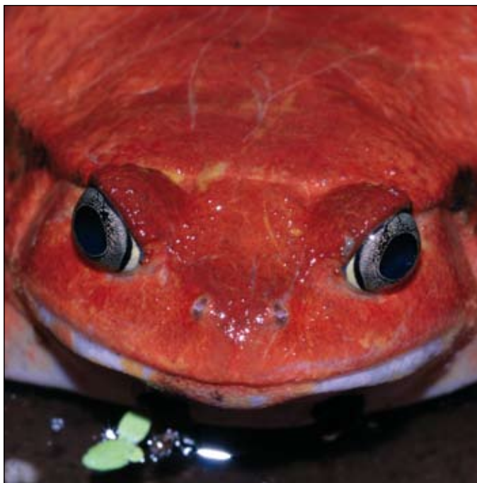
Dyscophus antongilii , Maroantsetra

The latter case should be carefully considered in relation to the expanding extraction industry in Madagascar and associated port improvements. In terms of the introduction of exotic animals, special attention should be paid to a recently introduced crayfish ( Procambarus sp.) that is becoming invasive in many areas of Madagascar's plateau. This crustacean is particularly invasive, due to the fact that it reproduces via parthenogenesis. Although Bd has not yet identified on potential crayfish vectors, further studies are needed, also to understand how this Procambarus has been introduced. Aquarium