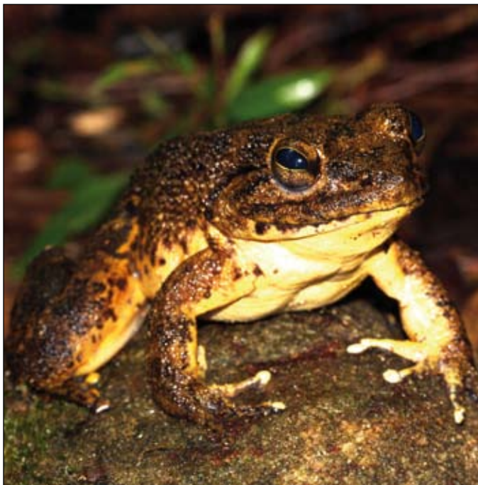
Mantidactylus cf. grandidieri , Betampona