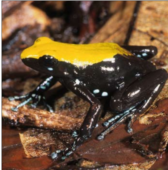
Mantella laevigata , Nosy Mangabe

It is our opinion that the “ex situ” colonies contribute to conservation through actions that do not always involve reintroduction (e.g., applied research, education) and recolonisation populations do not necessarily involve