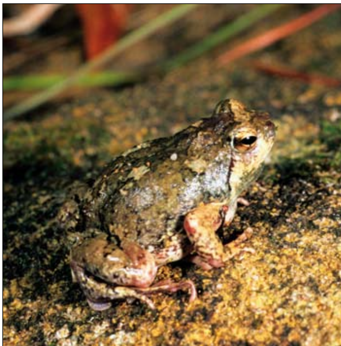
Scaphiophryne brevis , Isalo

It will also be important to understand human pressures