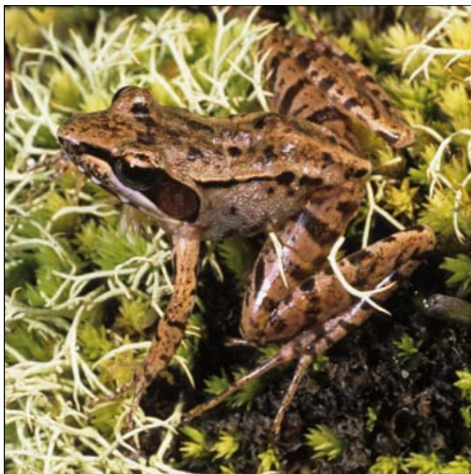
Mantidactylus brevipalmatus , Antioquia

Pour les suivis altitudinaux, il consistera probablement en 3-4 placettes le long du gradient, soit d'altitude ou de potentiel changement d'habitat, au cours de laquelle 5 transects linéaires, chacun long de 100 m, seront étudiés, au moins tous les deux mois. Environ 12 enregistreurs acou-