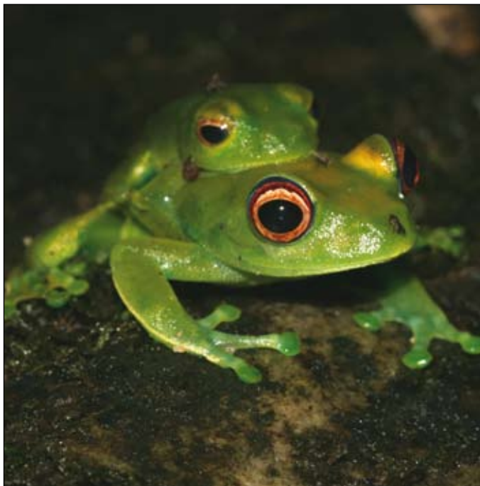
Boophis cf. luteus , Betampona

their skin. Mantella species are toxic and are apparently rarely predated upon by other vertebrate species, a situation in many respects to that of the Neotropical dendrobatid frogs. Their striking coloration has led to significant demand of wild amphibians for the hobbyist markets in Europe and North America. In contrast to these frogs, amphibians in the genus Boophis (subfamily Boophinae) are mainly arboreal, breed in water, and have a typical larval development. Egg laying usually occurs in streams, except for some species that reproduce in stagnant water. Two further genera belonging to Laliostominae, Aglyptodactylus