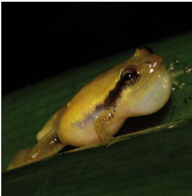
Platypelis sp., Betampona

The AES will also enable better coordination of all future activities related to the recommendations in this action plan by supporting the ASG chairs in its implementation. The various aspects of the action plan are to be implemented by the relevant stakeholders under the guidance of the coordinators. The action plan also serves as the