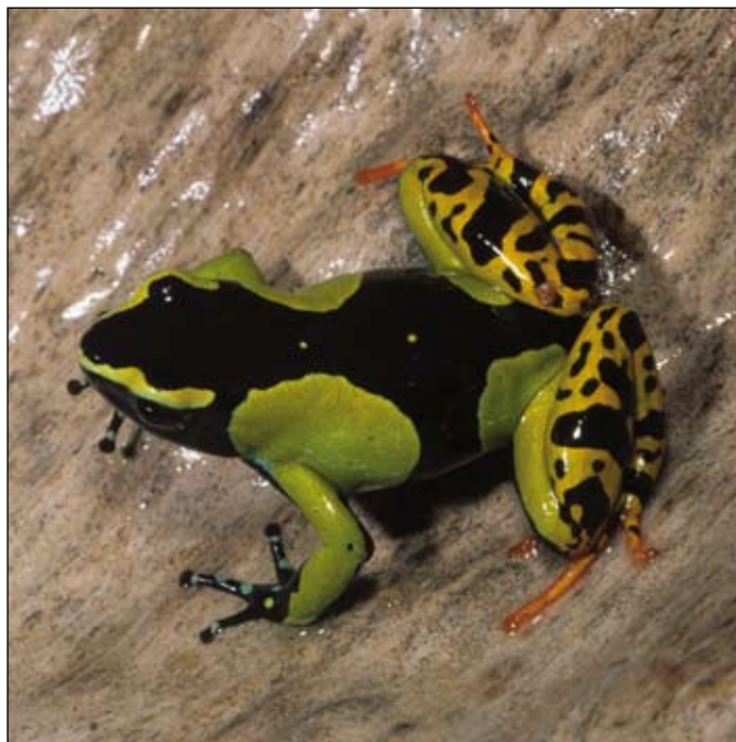
Mantella baroni , Ranomafana

avoisinant. De même, la stérilisation à la sortie de ces zones assure que les zones humides ne servent pas de vecteur de propagation d'agents pathogènes. Ceci est particulièrement important dans le cas du Bd parce que les conditions du milieu aquatique et forestier favorisent les conditions optimales de vie du chytride des amphibiens. Le contrôle devrait être également orienté pour empêcher l'introduction de pathogènes à partir des équipements utilisés. La meilleure façon de réussir le traitement est l'utilisation d'un équipement jetable autant que possible. Cependant, un équipement de travail trop onéreux ne peut pas être facilement