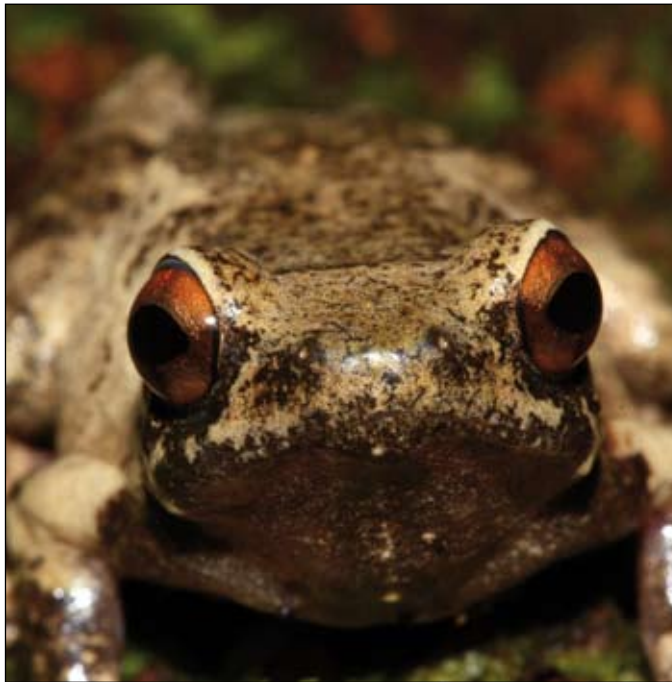
Platypelis sp., Betampona

The moment that the live animal trade is involved in an infectious disease system, the risks of pathogen dispersal within the system (Malagasy frogs) and beyond (export countries) increases considerably. Dealing in the international pet trade implies that Madagascar is a high-risk country for disseminating associated disease agents. Depending on whether it is present or not, the extent of the risk may be the likelihood that Bd may cause disease in amphibians acquired via Malagasy frog exports in importing countries, or the likelihood of disease in local Malagasy frogs if already present or as a consequence of introduction. Because the frog trade via Madagascar is unidirectional (exports only) the biggest risk for frog-to-frog transmission between countries is exporting potential pathogens from Madagascar. However, amphibian chytrid could enter Madagascar through the importation of tropical fish or other aquatic vectors or even via wet mud on footwear of people entering from abroad. Evidence is accumulating that climate change could, under particular conditions, foster the outbreak of Bd. Moreo-