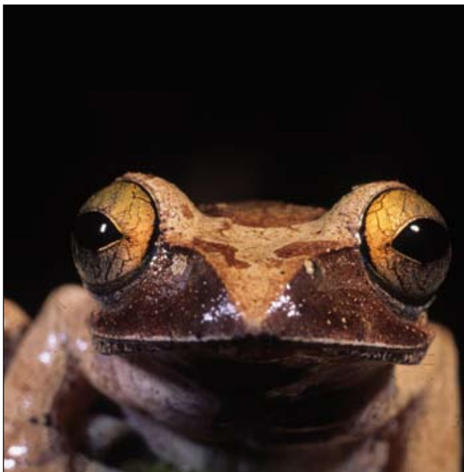
Boophus brachy chir , Ambolokopatrika

Antongil Conservation in collaboration with MRSN, ASG/ IUCN and PBZT with support by the BIOPAT Program. In this case the objective is to promote the conservation of the tomato frog, the only CITES I Malagasy frog species, in an urban area (Maroantsetra). This unique situation promotes conservation and education and public awareness, due to fact that local schools can easily understand why an iconic species like D. antongilii deserves to be protected.