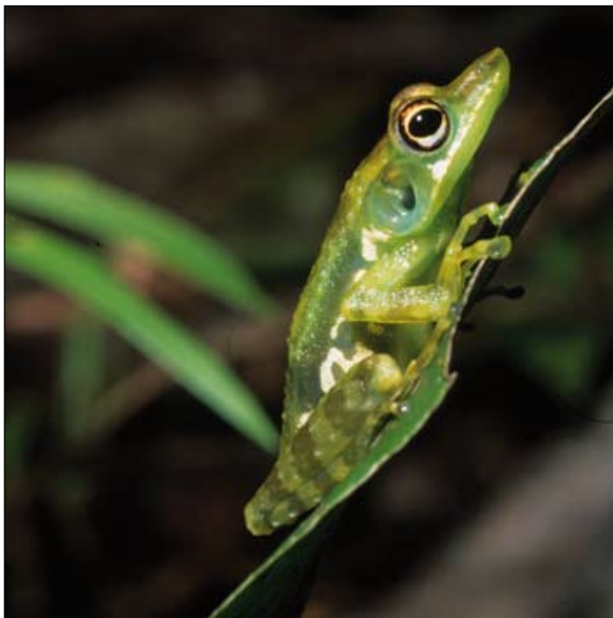
Mantidactylus argenteus , Sahavontsira

There is an evident contrast between the number of permitted animals collected for commercial and scientific purposes. In the commercial trade, a single authorized collector may collect hundreds of individuals, even from a single site. By contrast, a single authorized scientist is limited to five individuals per site. Such a difference should be reconsidered, particularly taking into account that the data obtained by scientists have clear conservation-oriented objectives.