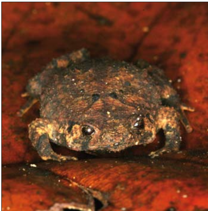
Rhombophryne coudreaui , Betampona

partenance écologique aux différents milieux (stratégies de reproduction et répartition altitudinale etc. - voir ci-dessous).