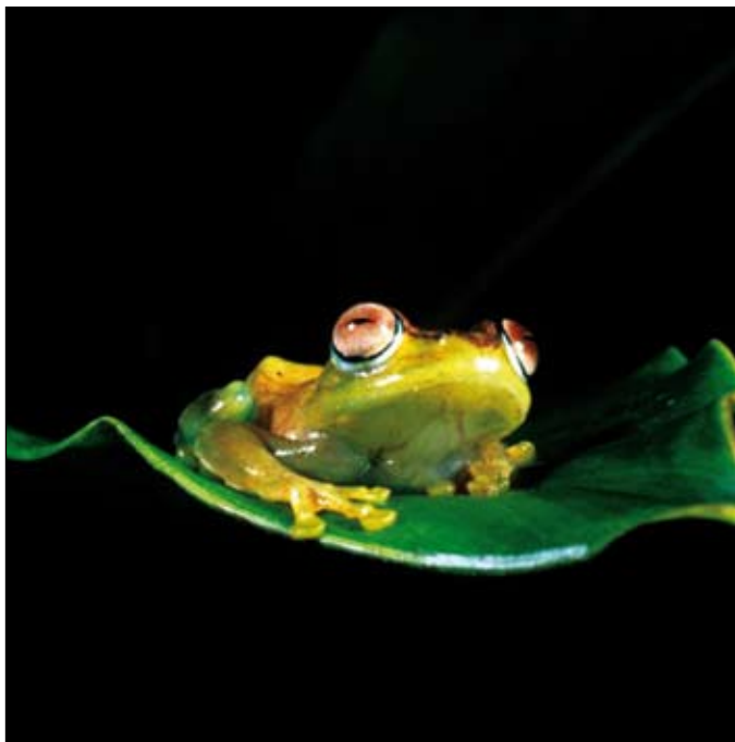
Boophis sp., Masoala

The objectives of the long-term monitoring approach are: