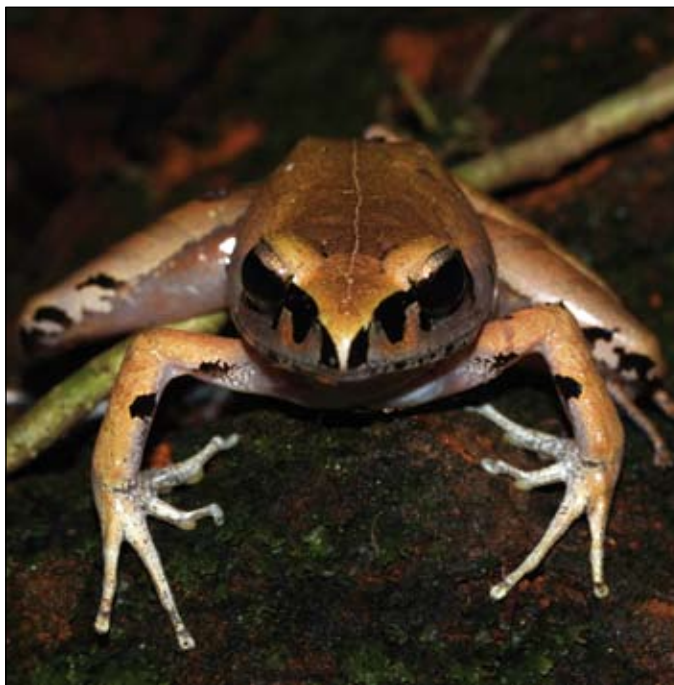
Aglyptodactylus madagascariensis , Farankaraina

The preferred technique for screening frogs should be sensitive and non-invasive such as swabbing for qPCR analysis. If reports of enigmatic declines occur, the affected areas should receive first priority. The survey should further include areas of high biodiversity and unique frog assemblages, areas of concern that have been under pre-