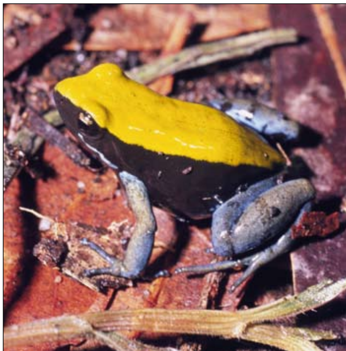
Mantella expectata , Isalo

Tissue sample is more often needed to determine the taxonomic identity of morphospecies. In general it is recommended that a single phalanx is cut for live adult individuals. For tadpoles a small piece of the caudal fin is often sufficient. The number of preliefs is variable, and depends on the opportunity to sample individuals that are thought to belong to a new, undescribed, or unidentified species, and the need to have anyhow tissue samples useful for genetic and other kinds of analysis. Tissue samples should be stored in eppendorf tubes filled with ethanol. Ethanol must not be denaturated and of high gradation (80-90% or absolute ethanol). Pure ethanol can be bought in Malagasy pharmacies. Tissue samples can also be obtained from museum specimens. The best results are obtained from vouchers fixed and preserved in pure ethanol, likely not so old (< 10 years). After being stored in eppendorf tubes the samples should be housed in low temperature or freezing.