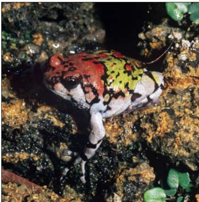
Scaphiophryne gottlebei , Isalo

The UADBA collection benefits from a more regular curatorial service by students and volunteers, and receives material (alcohol, jars, labels) from a large number of researchers collaborating with the university. A large part of the specimens have been collected during field expeditions with foreign researchers. Many specimens are sorted into separate jars by species, and are numbered by individual tags with consecutive UADBA numbers. All pertinent data are reported in hand-written catalogues and are at present digitized into an Excel-based spreadsheet database. Beside the herpetological collection there are also many other preserved zoological collections, such as the small mammal collection, the bone collection and the ichthyology collection. At least one UADBA professor coordinates the museum activity and the studies carried out on it. Currently, the collection is housed in an adequate local. Although the loan service is only partly activated, there is the prevision that in forthcoming years it will become available. The collection size is considerable, with an estimated 50,000-80,000 specimens, of which 30,000 are individually tagged and catalogued. In addition, there is an available computer from Sabin Fellowship devoted to preserved collections at UADBA but a constraint is lacking of the person to do this task. Following this primary effort, UADBA is obtaining a collaboration with Vahatra to pay a salary of the permanent curator for all specimens at the university.