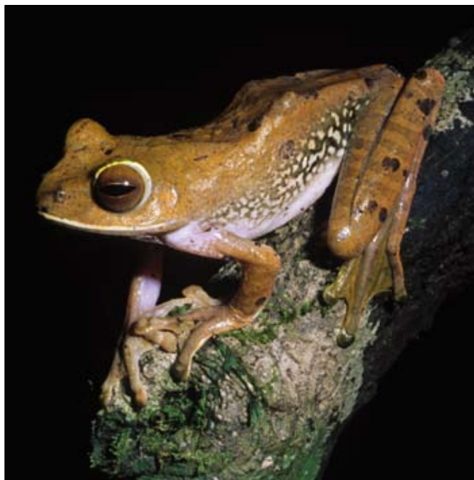
Boophis albilabris , Masoala

The institutions involved will be chosen on the basis of their experience, facilities, desire to work with Malagasy amphibians, and belonging to a recognised zoo and aquarium body, namely belonging EAZA. In the critical early stages of establishing “ex situ” populations of highly threatened species, institutions that do not have practical experience should not be included. Thus it is likely that Malagasy institutions potentially interested being part of the “ex situ” programme will join the conservation breeding programmes only after they have gained significant experience in amphibian keeping and breeding through the management of more common species, perhaps some of