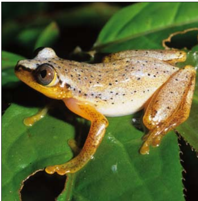
Heterixalus punctatus , Sahavontsira

Comparatively little is known on the trade of the Malagasy amphibians in terms of numbers of individuals captured in the wild. This is important, since it is compulsory to have information on the mortality rate through the trade chain. Even if exportation quotas could be established and maintained, further attention must be paid to the lower levels of the chain. In such a context, we propose a national and international network to monitor trade. We also recommend that TRAFIC and CITES networks are involved in this step. This will involve gathering import/export statistics, commercial breeding farm data and regular visits to the food, medicinal and pet markets. It is important to gather data to improve our understanding of the network structures, mechanisms and dynamics operating in the trade, such as the number and location of collectors, the number of intermediaries and their operational areas and the way they link with collectors and exporters. Current knowledge should be mapped at a national scale to identifying the gaps in knowledge. Furthermore, it is worth collecting data to improve our understanding of the economic structures, mechanisms and dynamics operating in the trade, such as the price differ-