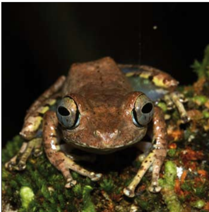
Boophis sp. "calcaratus", Betampona

Ces observations nous apprennent les réponses des espèces face aux changements climatiques, leur dispersion et leurs moyens d'adaptabilité aux nouvelles conditions. Cela nous permet de répertorier les aires de refuges des amphibiens pour savoir les gérer ou les compenser suite au changement climatique. Nous aurons aussi une meilleure connaissance des axes de conservation du territoire à savoir le reboisement et l'amélioration de la forêt existante.