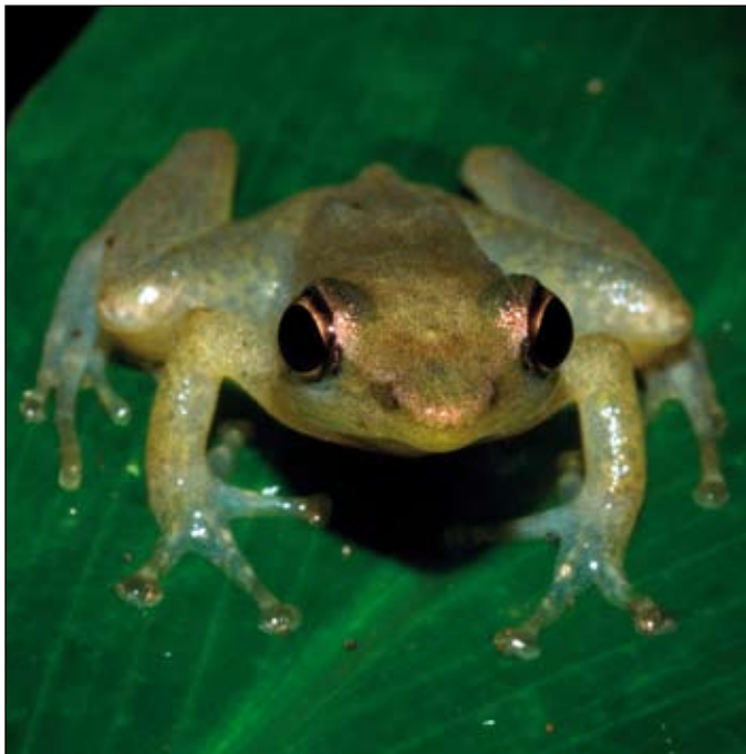
Blommersia sp., Betampona

The fieldwork in Madagascar in terms of amphibian survey is usually accompanied by the collecting of voucher specimens. Although part of these specimens are exported and consequently housed in the zoological collections of another country, it is crucial that a public national collection (or a series of public collections) is available in Madagascar. Most conservationists agree with the validity of these general considerations. Since most of them are involved in the taxonomic research that is at the basis of biodiversity assessment, they are concerned about the possibility that collected specimens are housed in a convenient institution, in order to make them useful in terms of conservation.