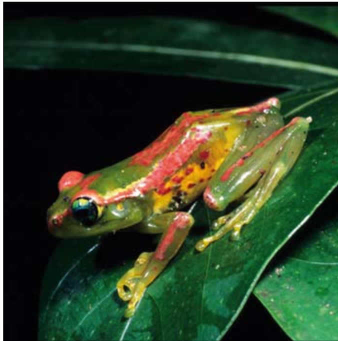
Boophis ulftunni , Masoala

One possibility is that this could be done via the application of data processing models such as “population viability analysis” (PVA) to the critical species, by determining