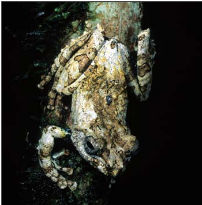
Boophis lichenoides , Tsararano

Seen that some species are at higher risk of extinction due to the need to displace through a system that is highly fragmented it is important to carry out long-term monitoring of the major high altitude species, i.e. those ones restricted to mountain's tops. Most of these species are also local endemisms and for this worth of special attention. Incidentally, moreover, the Bd appears to be more virulent at high altitudes, having attacked and often decimated frog species living at high altitudes. Seen that climate change is unlikely to be reversed it should be hypothesised to start a captive breeding program on high altitude species, including ark strategies that will allow to save, at least in captivity, these peculiar species.