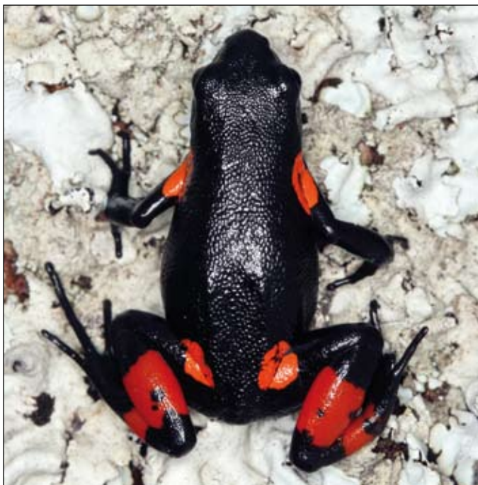
Mantella cowani , Antioetra

Captive populations of a few exploited amphibian species have been established and in some cases ex situ breeding provides additional animals for the pet market. Remarkable examples include Mantella species (e.g., Mantella aurantiaca , M. baroni , M. betsileo ), Dyscophus guineti and Scaphiophryne marmorata . However, the majority of animals that are traded continue to be collected from the wild. All the Mantella species are included in CITES Appendix II, which also includes Scaphiophryne gottlebei . The tomato frog Dyscophus antongilii , heavily collected in the wild until the eighties, is currently included in CITES Appendix I (and for this is collect and trade are forbidden). Of concern are the species of the genus Scaphiophryne , such as S. marmorata and S. boribory , and Dyscophus guineti , which are not yet included in any CITES listing, but appear in the pet trade.