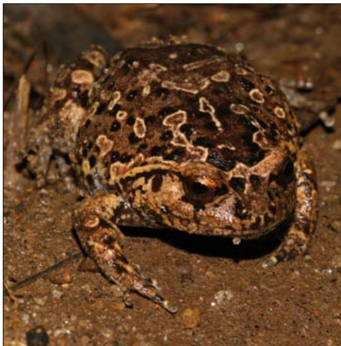
Plethodontohyla cf. brevipes , Betampona

The safest and most responsible way to proceed with the keeping of all amphibians in captivity is to treat all animals as potentially infected (with chytrid and/or other pathogens) and avoid the discharge of potentially infectious water and other materials into the environment (where they may infect local native amphibian populations). Furthermore, increasing awareness of biosecurity issues and introducing a quarantine-like approach to amphibian husbandry of enclosures/rooms within an institution and between institutions will significantly reduce the risk of an epidemic outbreak of chytridiomycosis (or other disease) in captivity.