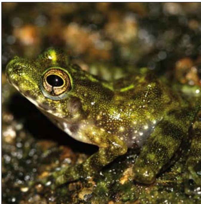
Gephyromantis webbi , Farankaraina

together with the online catalogue. Of course, all researchers need to be able to access without restrictions all specimens collected by their own research group. By a public guest book, it needs to be obvious to everybody who is accessing which specimens for which research goals. For a limited period, still to be determined, researchers maintain the right of being informed about other researchers accessing specimens collected by them, and, more importantly, publications based upon these specimens should only be possible by previous authorization of the collectors within this time frame, which for example could be ten years.